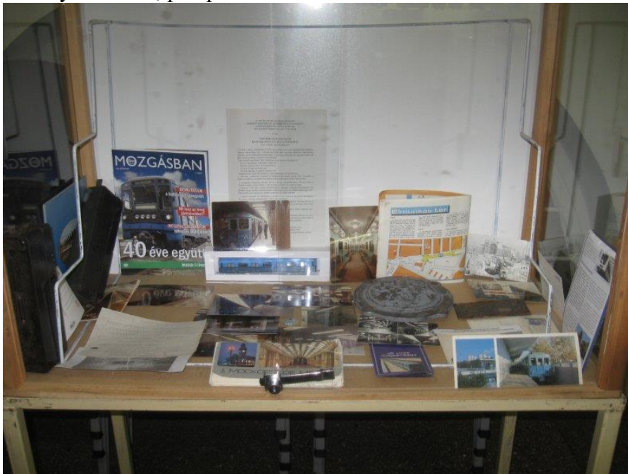
40 éve adták át a budapesti kettős metró első szakaszát – MAVOE 2010

MAVOE (Magyar Vasútmodellezők és Vasútbarátok Országos Egyesülete): idén három vitrinrel, egy bemutató H0 pályával és gyermek játszósarokkal szerepeltünk a Keleti pályaudvaron rendezett nemzetközi vasútmodell kiállításon. A játszósarok anyagát – LEGO akkus iparvasút működtethető kiegészítőikkel – a szervezők jövőre is meghívták, a felkérést elfogadtuk. Témák: 40 éve adták át a budapesti Kelet-Nyugati metró első szakaszát – régi képeslapok, néhány alkatrész, prospektusok voltak kirakva.