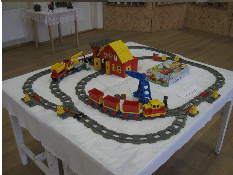
Játéklehetőségek a csolnoki falunapokon, 2010

sajnos kevés látogató jött be, de nekik nagyon tetszett és a kipróbálható, működtethető dolgok is jó ötletnek tűntek – folytatni kívánjuk ezt az irányt mind egy játszószarok kialakításában, mind a múzeum gyűjteményének minél nyitabb (üveg- és nyúljonhozzámentes) bemutatásával, működő- és működtethető készülékekkel (pl. telefonközpont, látogatói telefonvonal, hajtánypálya, kipróbálható jelzőberendezések).