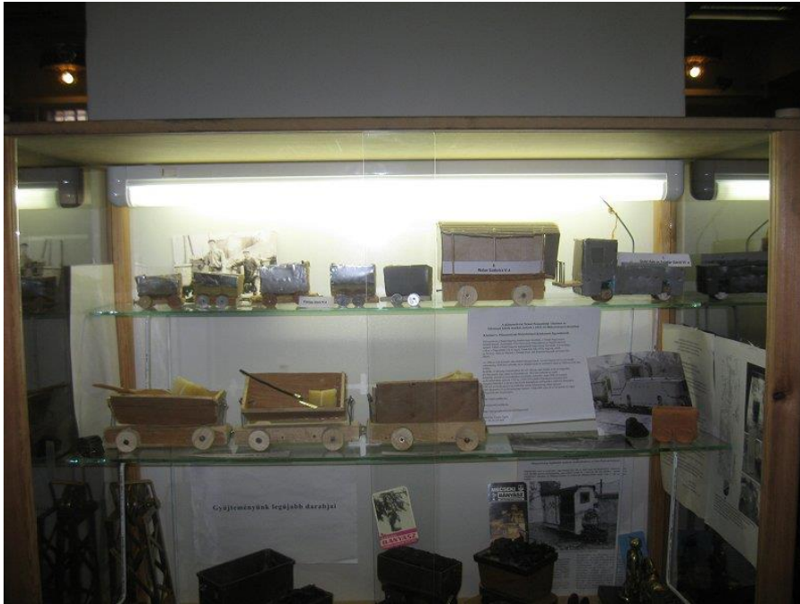
A pilisszentiváni iskolások technika órai modelljei – MAVOE 2010

bányavasúti járműmodelleket készített fából, kartonból, fémből. Ezek közül egy fél vitrinnyit kölcsönkértem a MAVOE kiállításra. A szervezésért köszönet a Pilisszentiváni Helytörténeti Egyesületnek.