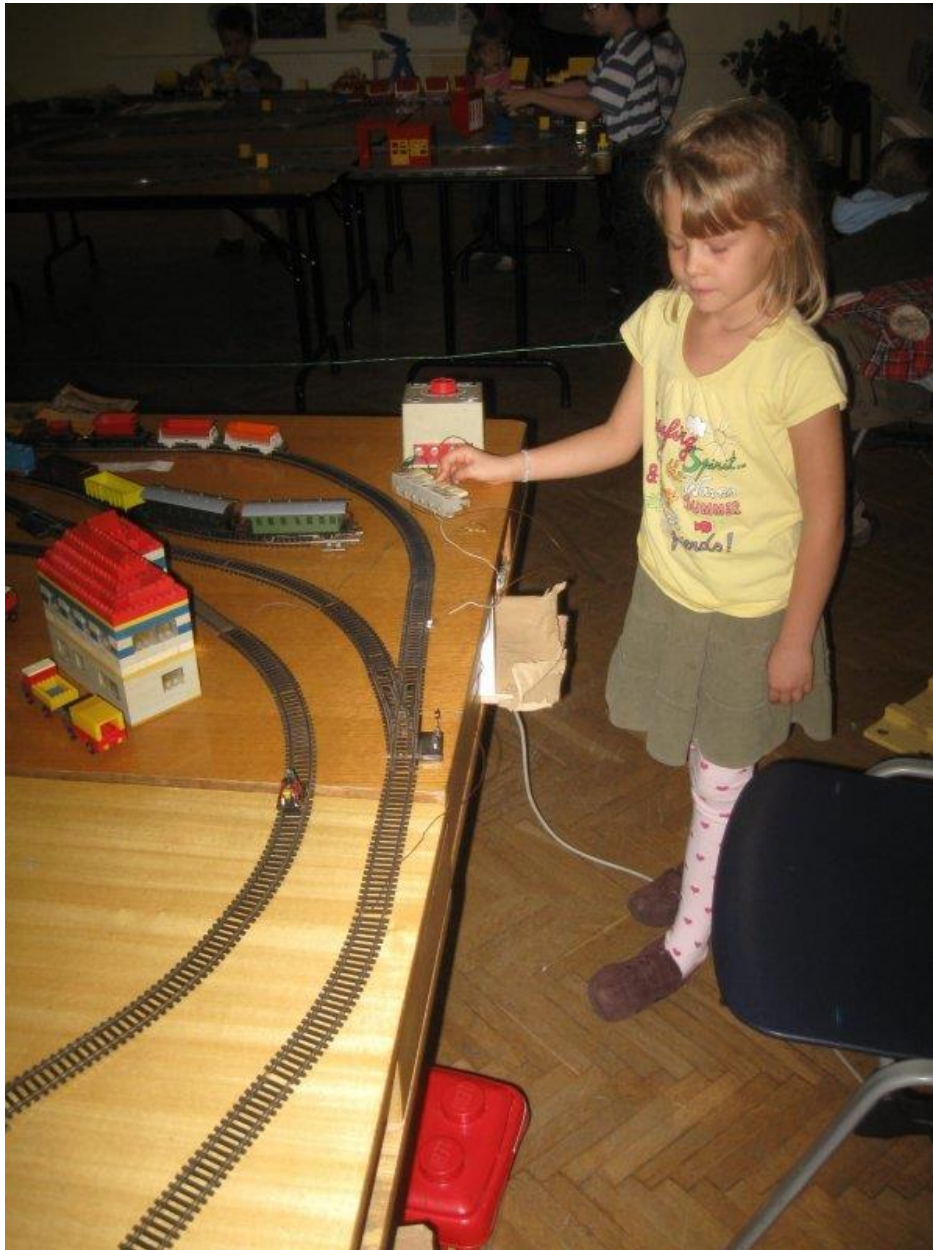
Játék a kézhajtány modellel – MAVOE 2010

Játzósarok: egy jó hosszú, tekervényes pálya lett összerakva két szállítószalaggal, csilletöltő épülettel, őrházzal. Egyidejűleg két vonat járhatott a pályán: akkus mozdony a nagyobbaknak és tologató gőzös a kicsiknek.