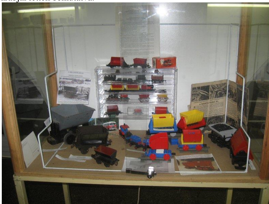
„Játék- és modell – a billenőcsille” MAVOE 2010

A harmadik vitrinben a „Játék- és modell – a billenőcsille” gyűjtemény modellpályán nem futtatható darabjai lettek bemutatva.