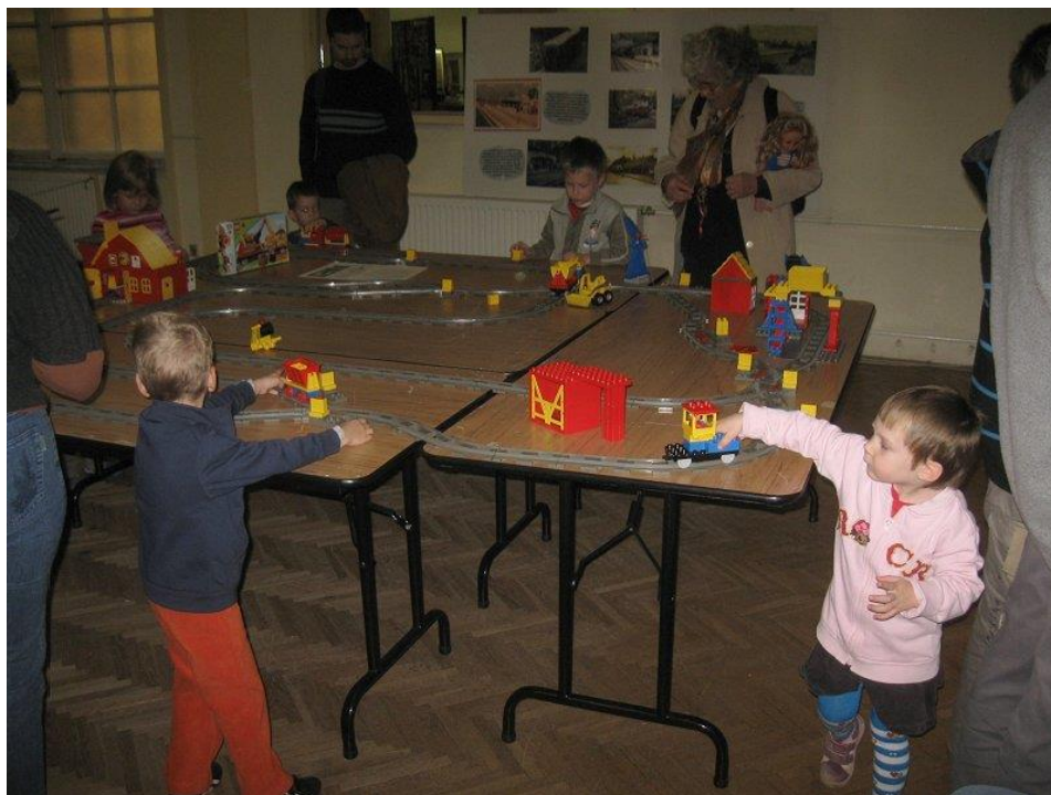
Játéksarok – MAVOE 2010

Ez volt az első komolyabb bemutatkozása ennek az ideai újításnak, a tapasztalat szerint a kicsiknek és nagyobbaknak kirakott pályát célszerű lesz szétválasztani. Ez utóbbihoz egy földre teríthető játszószőnyeget (az árát még nem tudjuk) szeretnénk venni.